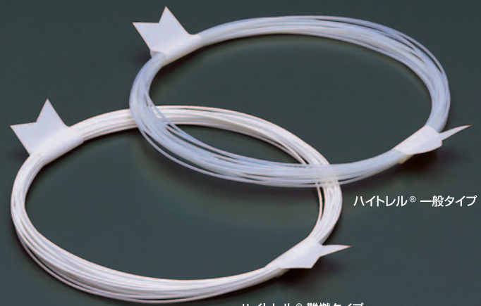
ハイトレル ® 一般タイプ